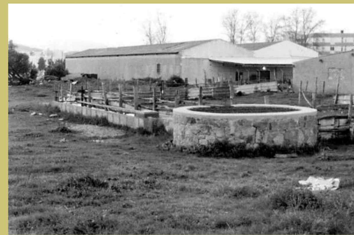
Pozo de la Higuera

El agua, algo tan fácil de conseguir en la actualidad, era un bien muy escaso no hace tantos años y conseguirla costaba mucho trabajo y esfuerzo, ya que el agua corriente en las viviendas aún no existía y eran escasos los pozos y fuentes de los que podía surtirse la mayor parte de la población.