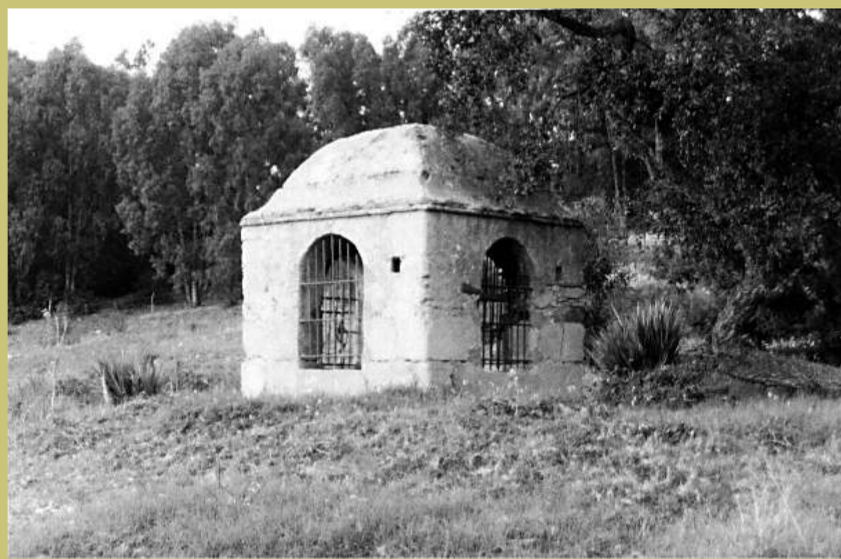
Pozo de Coca