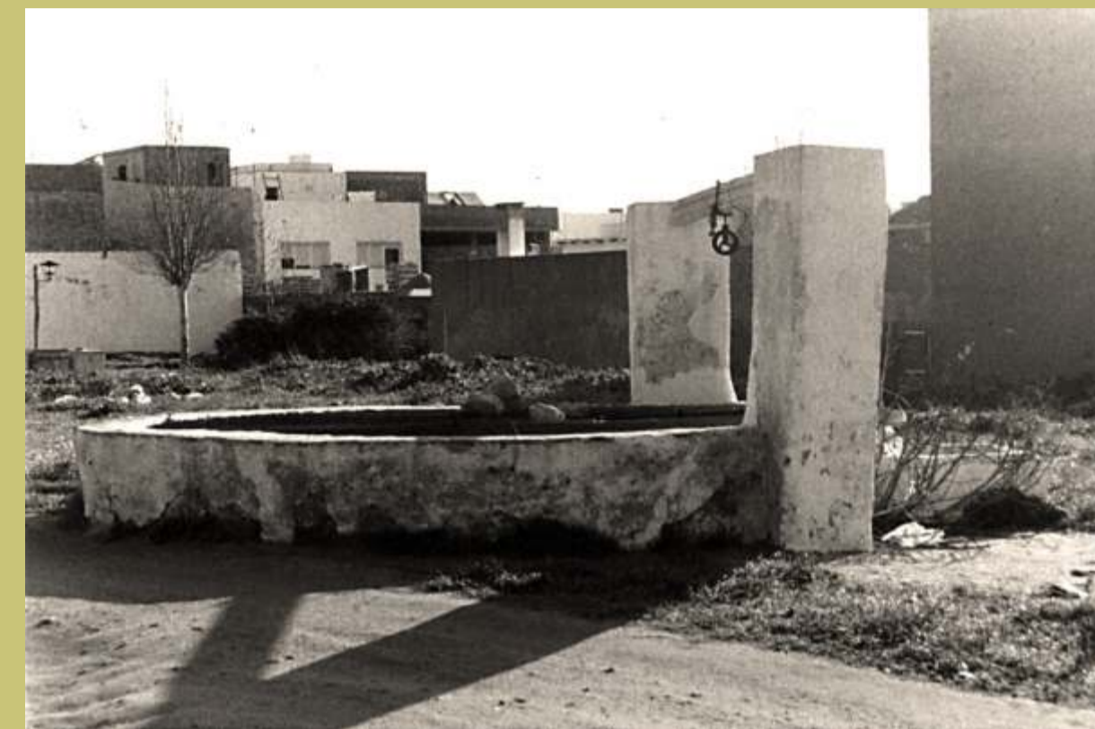
Pozo de las Perenholas