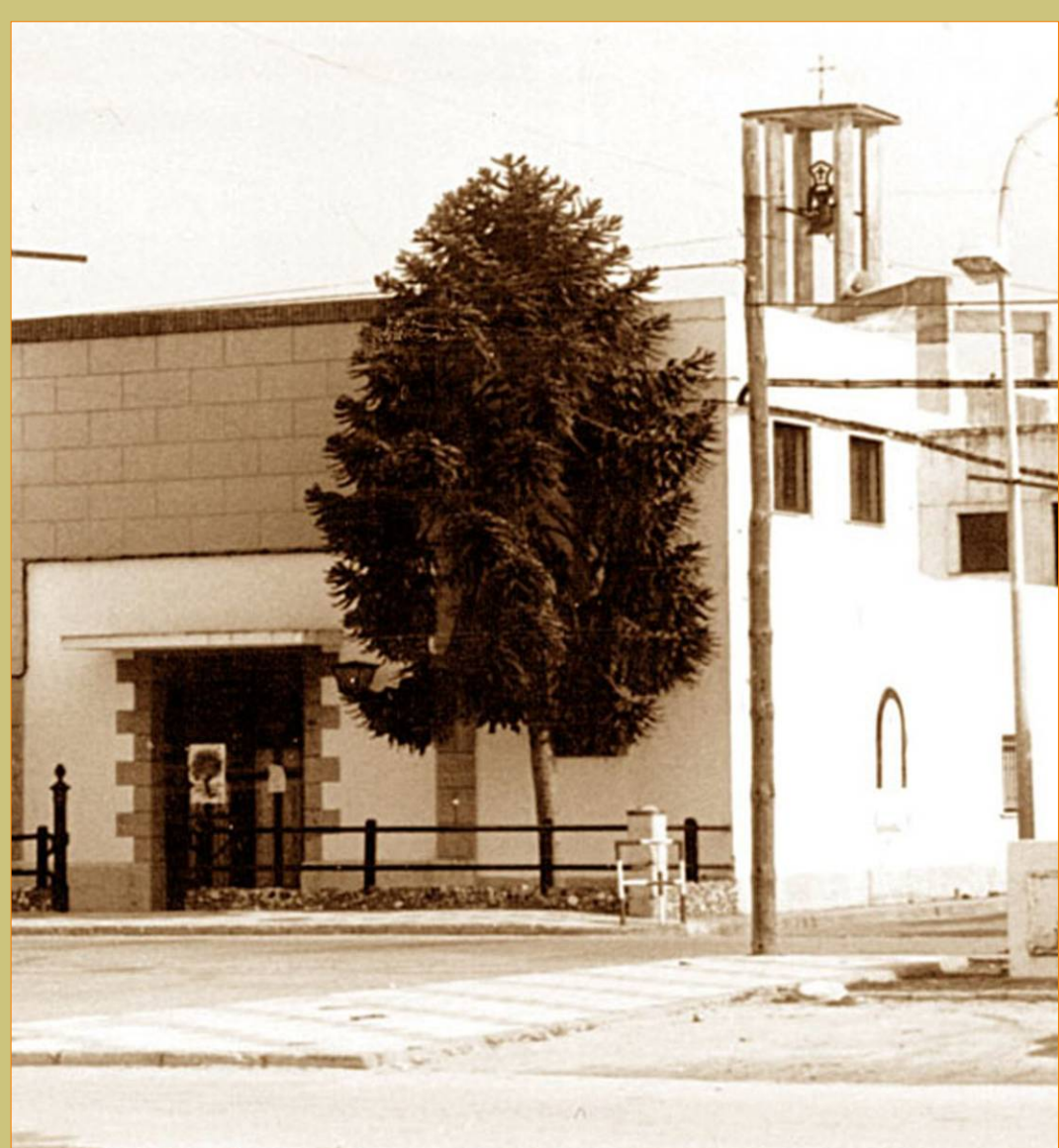
Iglesia Parroquial. Año 1966

Alberga la imagen de la Virgen del Carmen, Patrona de los marineros.